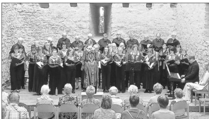
Die zwei Chöre des „Geraberger Liederkranzes e.V. beim Auftritt im Juni 2023 in der Liebensteiner Burguine